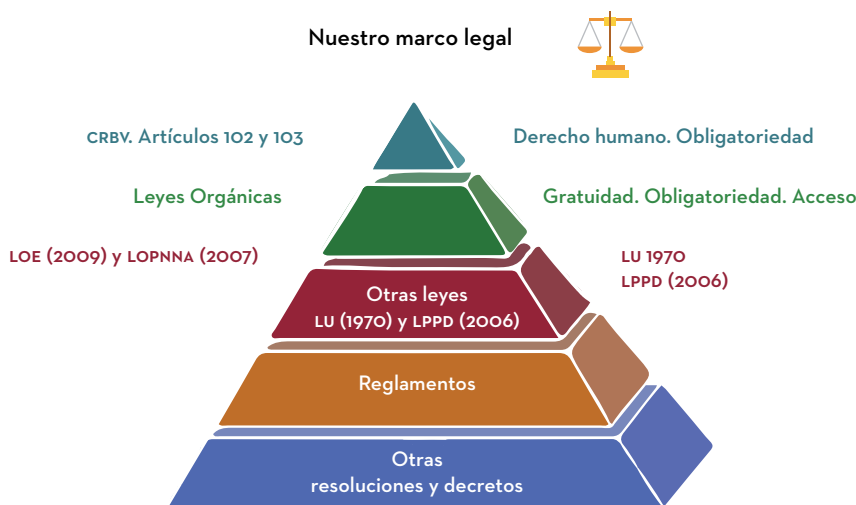
FIGURA 4.1 MARCO LEGAL EN MATERIA DE EDUCACIÓN

actores clave (las familias, los medios de comunicación, las empresas, entre otros) se indican, pero sus acciones están mediadas por el estado.