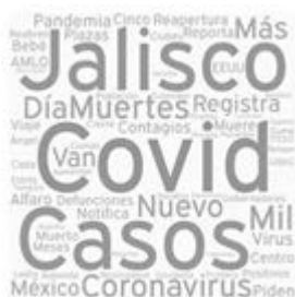
FIGURA 1.1 NUBE DE PALABRAS EN LA QUE SE PROCESARON LOS TITULARES DE LAS NOTICIAS ENCONTRADAS EN LOS SEIS PORTALES ESTUDIADOS

NTR Guadalajara, 12 de junio), “Ante alza en casos de COVID-19, cero tolerancia en reapertura” (El Informador, 4 de junio de 2020); mientras que Milenio Jalisco no publicó ninguna noticia en esta categoría, El Diario NTR Guadalajara y Mural mostraron este énfasis en más ocasiones, con seis piezas cada uno.