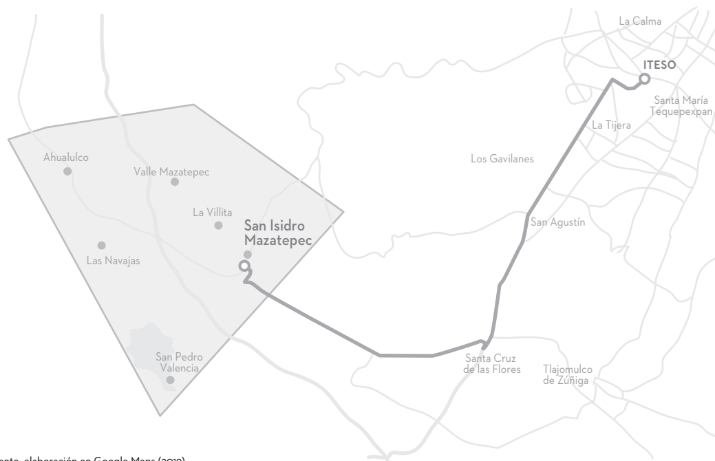
FIGURA 7.3. VALLE MAZATEPEC Y EL CAMINO DESDE ITESO