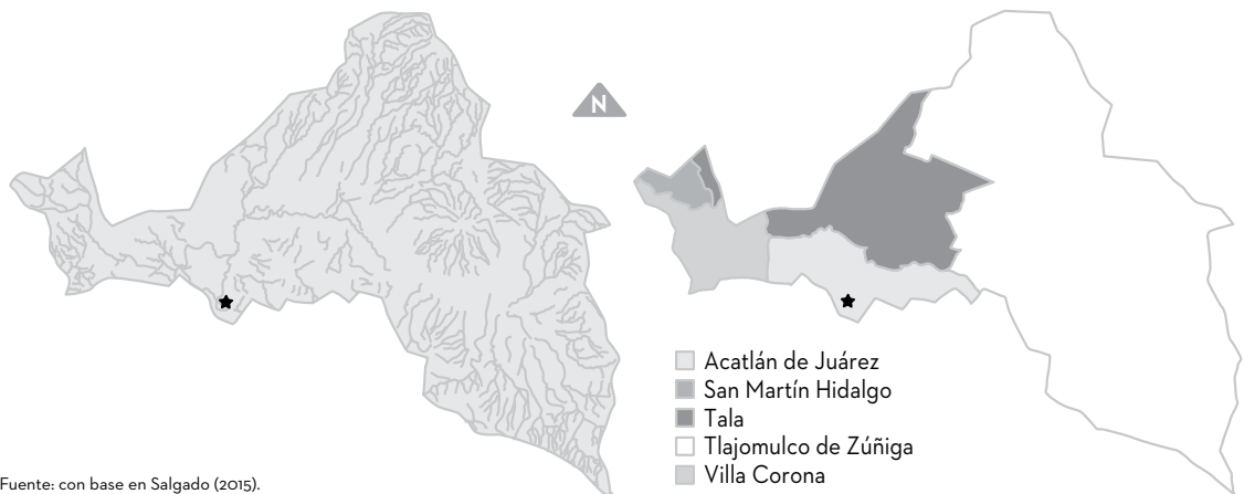
FIGURA 7.2. MICROCUENCA DE LA PRESA DE HURTADO Y MUNICIPIOS CON LOS QUE COINCIDE